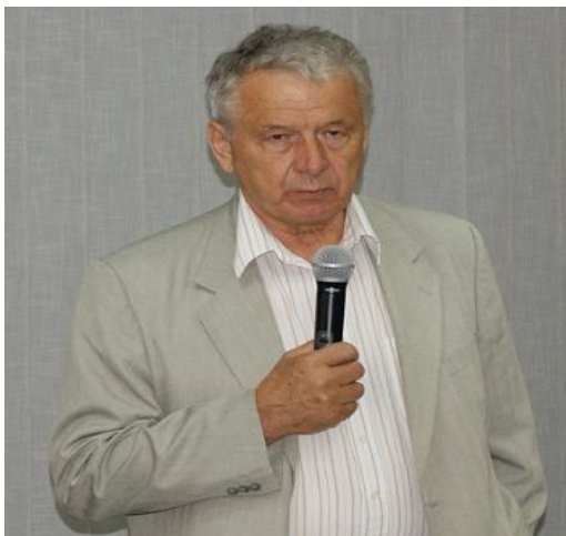
Академік НАН України В.М. Геєць

Потім слово взяв віце-президент Національної академії наук України, директор Інституту економіки та прогнозування НАН України (м. Київ) академік НАН України В.М. Геєць . Він акцентував увагу на двох аспектах розвитку металургії – зовнішньому та внутрішньому, відмітивши, що на світових ринках у галузі завжди буде значна кількість проблем, зокрема внаслідок швидкого розповсюдження більш дешевих матеріалів-замінників, тоді як внутрішнє споживання металопродукції власного виробництва має значний потенціал через необхідність масштабної реконструкції діючих потужностей.