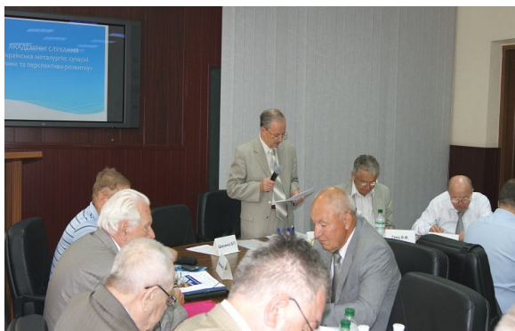
Президія Наукової ради академічних слухань

Потім слово взяв віце-президент Національної академії наук України, директор Інституту економіки та прогнозування НАН України (м. Київ) академік НАН України В.М. Геєць . Він акцентував увагу на двох аспектах розвитку металургії – зовнішньому та внутрішньому, відмітивши, що на світових ринках у галузі завжди буде значна кількість проблем, зокрема внаслідок швидкого розповсюдження більш дешевих матеріалів-замінників, тоді як внутрішнє споживання металопродукції власного виробництва має значний потенціал через необхідність масштабної реконструкції діючих потужностей.