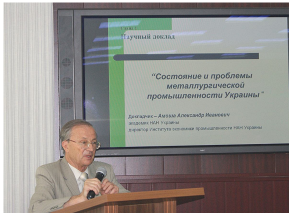
Академік НАН України О.І. Амоша

(співавтори: д.е.н. Ю.С. Залознова, к.е.н. Л.О. Збарзська, к.е.н. В.А. Нікіфорова).